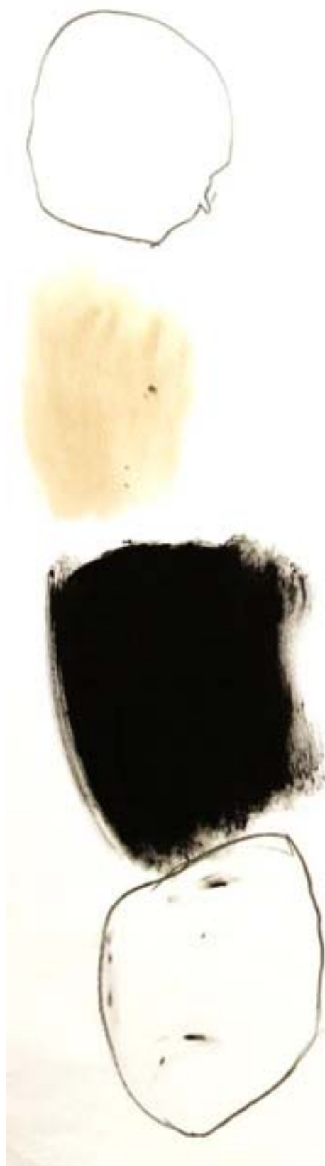
Minne från Bagdad II (beskuren) | blandteknik, 107x80 cm, 2003.

Många ungdomar väljer att gå de estetiska utbildningarna på gymnasieskolan. Därefter utbildar de sig ofta vidare vid universitet och högskolor utanför länet och utövar senare sitt yrke i större städer i Sverige eller utomlands. Kulturella miljöer måste utvecklas i länet som gör det attraktivt för kulturaktiva – både professionella och amatörer – att bo och verka i Dalarna. Genom detta kan möjlighet ges till flera av våra ungdomar, som gått olika utbildningar, att återvända till Dalarna.