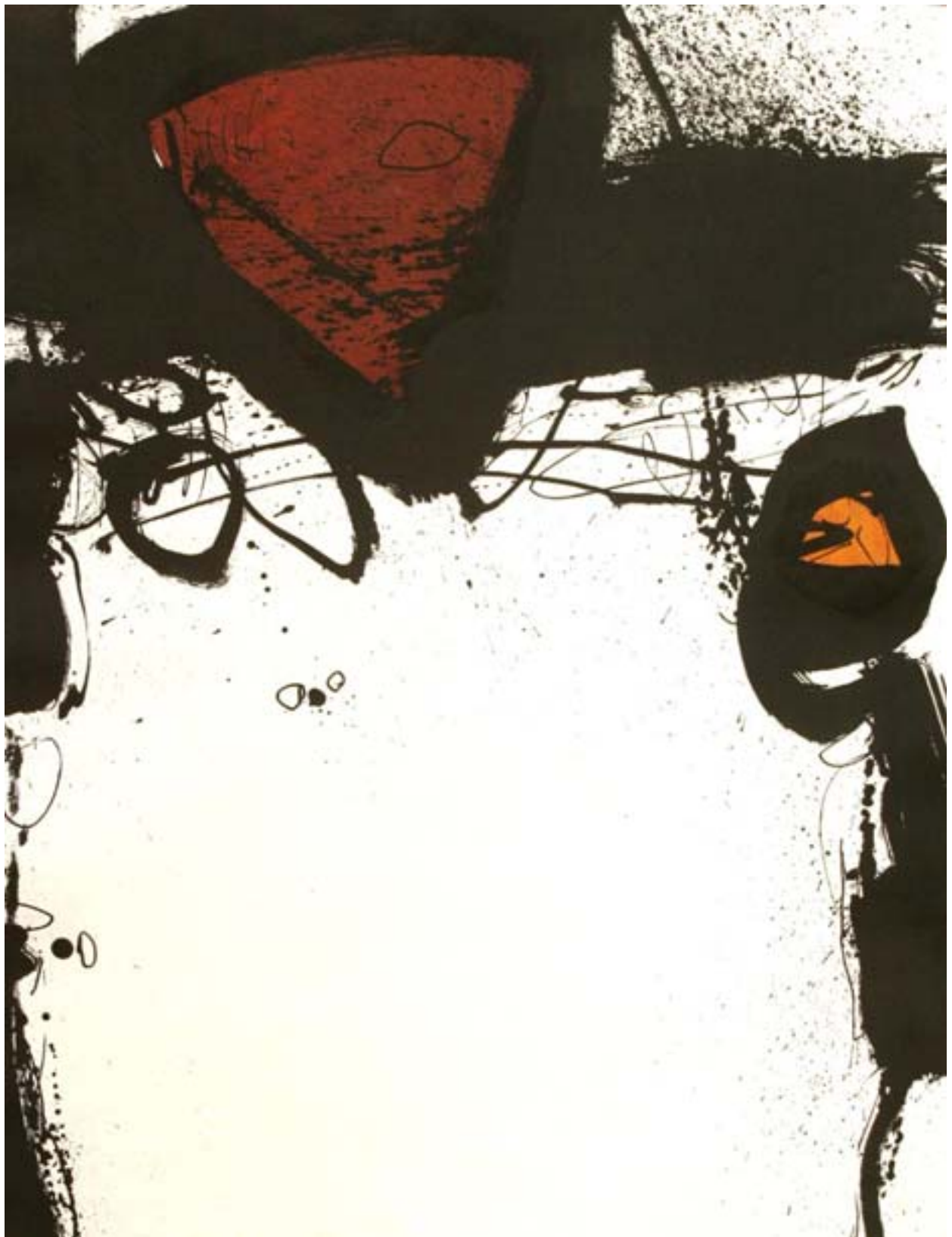
Ansiktet | plantryck / chine collé, 108x78 cm, 2004.