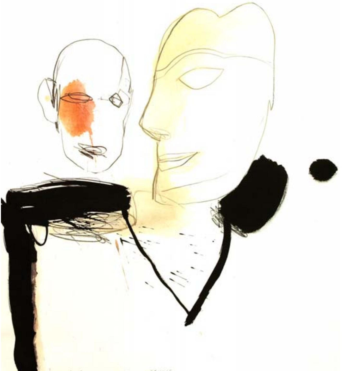
Minne från Bagdad I | blandteknik, 107x80 cm, 2003.