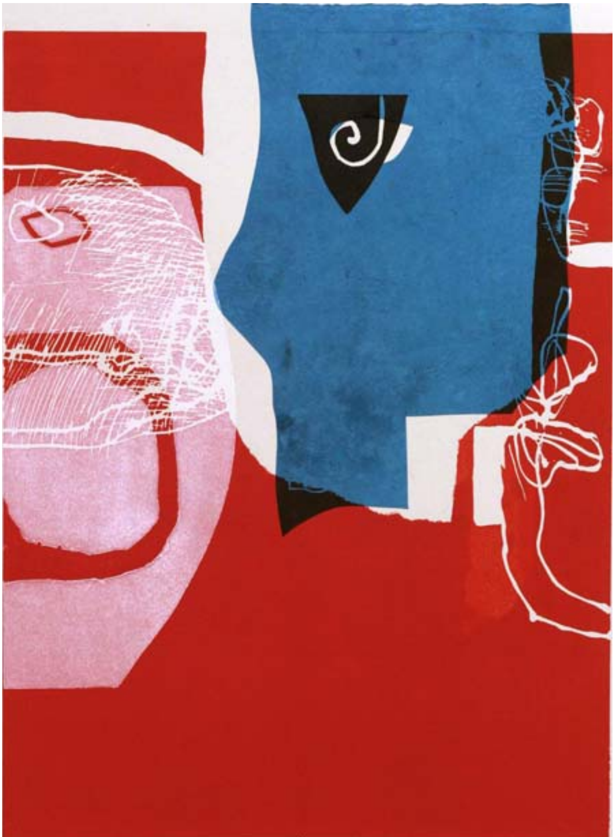
Utan titel | blandteknik, 60x43 cm, 2005.