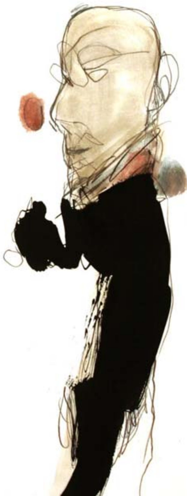
Minne från Bagdad II [beskuren] | blandteknik, 2003.

Den konstnärliga friheten utgör en omistlig del av yttrandefriheten. En utmanande och radikal kultur är en förutsättning för demokratis fortbestånd och utveckling.