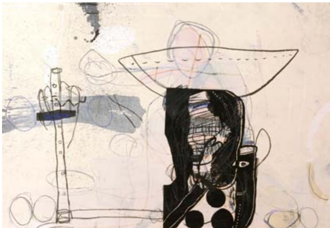
Utan titel | blandteknik, 71x102 cm, 2003.