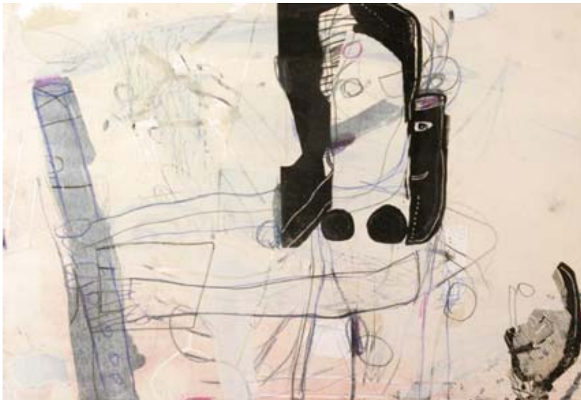
Utan titel | blandteknik, 71x102 cm, 2003.