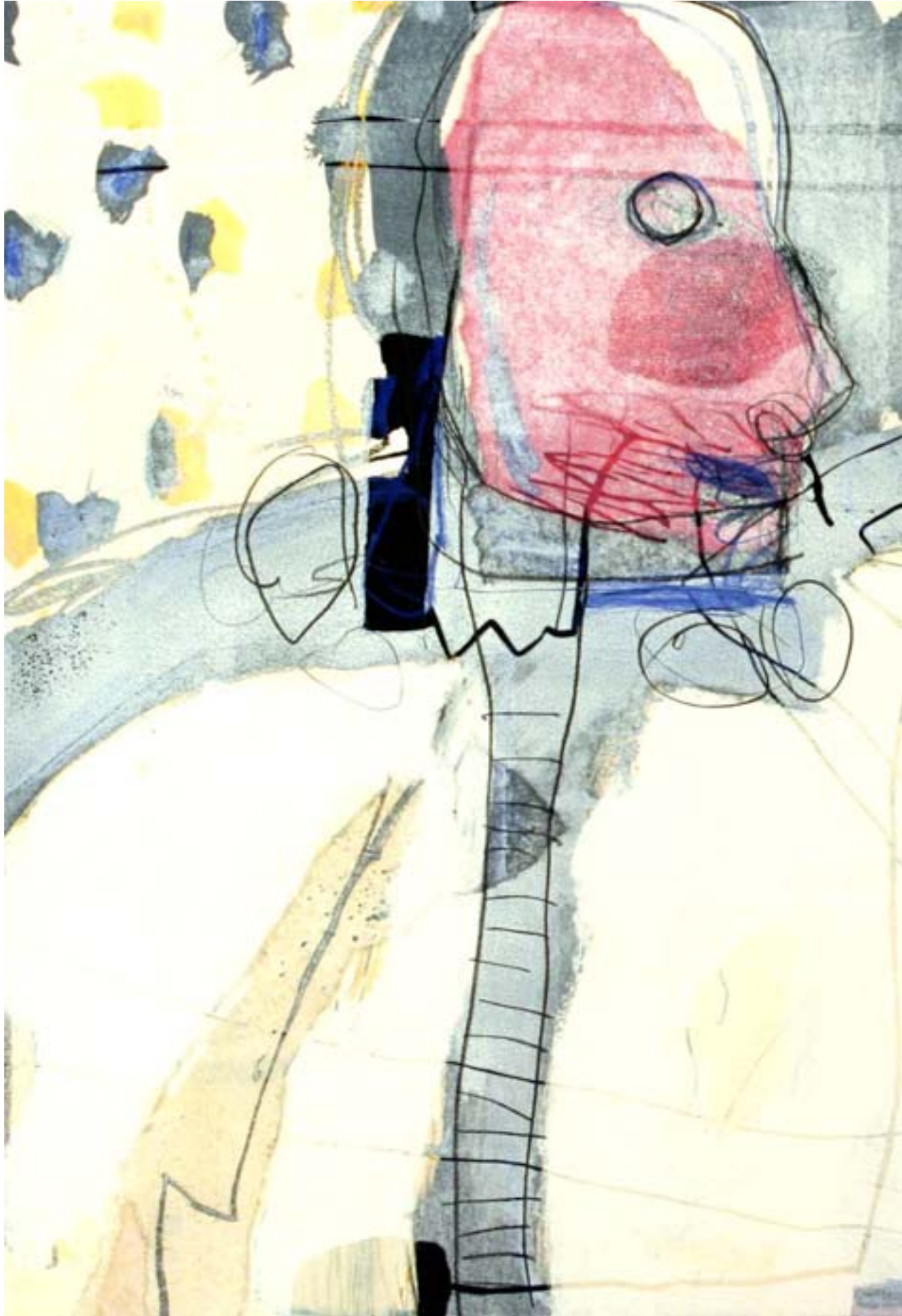
Utan titel | blandteknik, 80x108 cm, 2003.