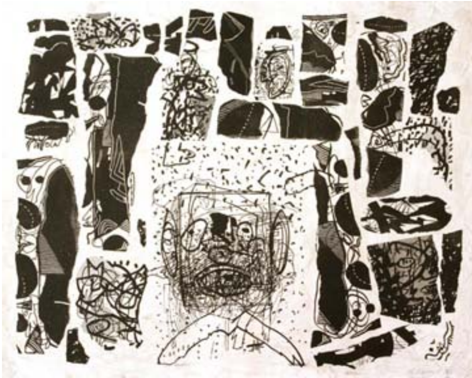
Porträtt av Ivan Aguéli III | plantryck, 71x88 cm, 1995.