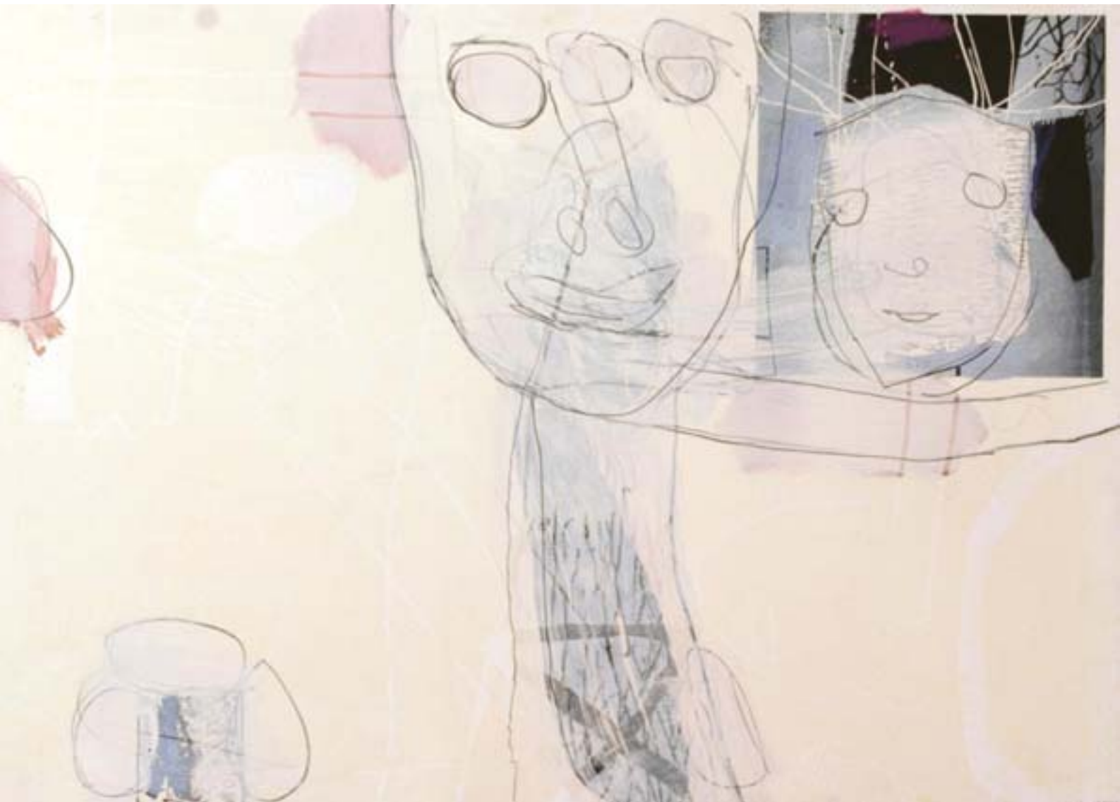
Utan titel | blandteknik, 70x100 cm, 2003.